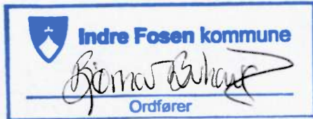
Ordfører Indre Fosen (Kommune)

Denne avtalen skal være fast sak på politirådets første møte hvert år for evaluering. Avtalen kan endres dersom politi eller kommune mottar nasjonale føringer som tilsier at dette er nødvendig.