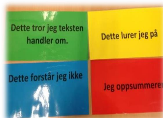
Bilde: Lesestrategier – rollekort

Lærer viser deretter noe fra teksten, f. eks. overskrifter, ingress, bilder og bildetekster, og i makkergruppene gjetter de innholdet og deler sine første inntrykk av hva denne teksten kan handle om. 1. rolle har ansvaret for at denne aktiviteten skjer i sin gruppe. Teksten deles ut og hver elev leser teksten stille, så langt som er avtalt, før makkergruppen jobber videre med forståelsen av innholdet. Hver rolle har ansvaret for at den respektive aktiviteten gjennomføres i sin gruppe.